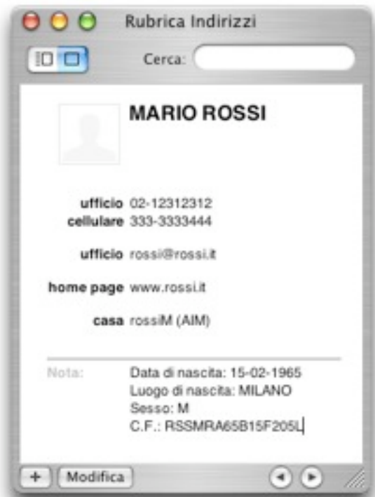
Rubrica Indirizzi MacOSX